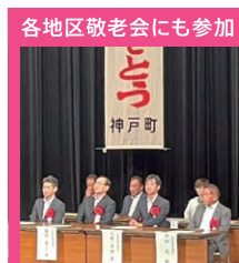
各地区敬老会にも参加