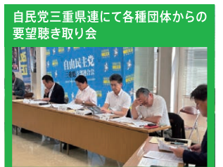
自民党三重県連にて各種団体からの 要望聴き取り会