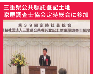
三重県公共嘱託登記土地 家屋調査士協会定時総会に参加