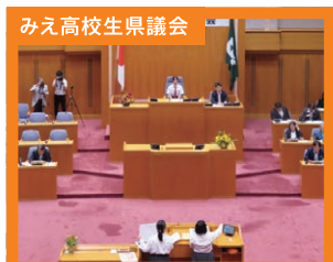
みえ高校生県議会