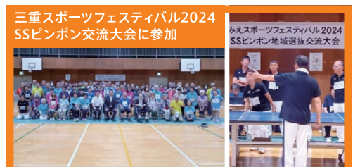
三重スポーツフェスティバル2024 SSピンポン交流大会に参加