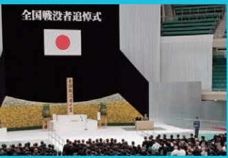
全国戦没者追悼式