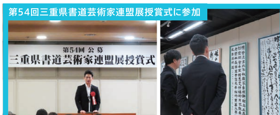
第54回三重県書道芸術家連盟展授賞式に参加