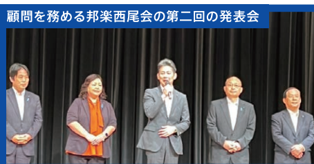
顧問を務める邦楽西尾会の第二回の発表会