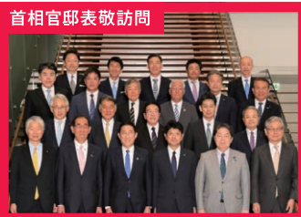
首相官邸表敬訪問