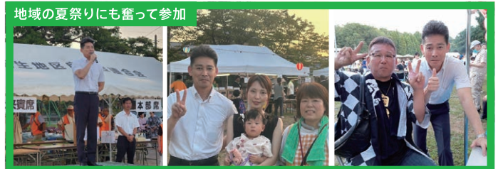
地域の夏祭りにも奮って参加