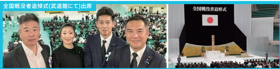
全国戦没者追悼式(武道館にて)出席