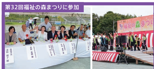
第32回福祉の森まつりに参加