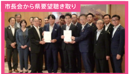
市長会から県要望聴き取り