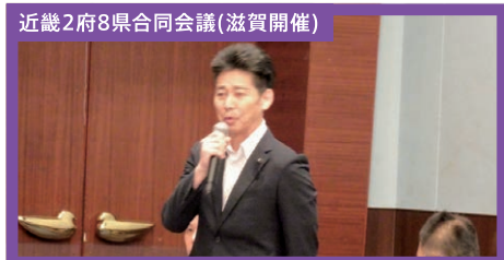
近畿2府8県合同会議(滋賀開催)