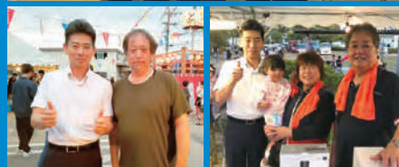
地域のお祭りにも進んで参加