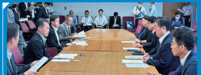
線状降水帯による、被害復旧支援のため、知事に要望