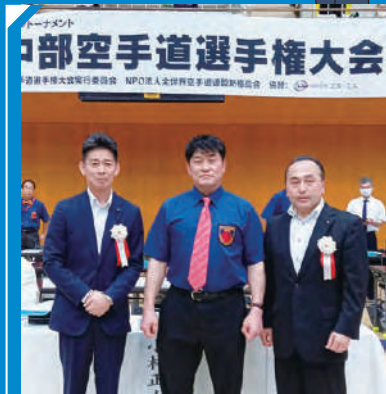
青少年健全育成全中部空手道選手権の実行委員長として