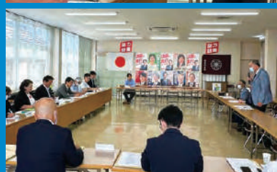
県内各種団体からの要望聴き取り会