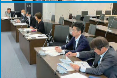
北海道へてるの家、北海道庁にて、ひきこもり対策についての現地調査やヤングケアラー条例制定に向けた取り組みを調査