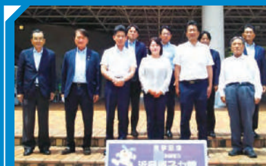
放射性廃棄物対策の現状調査(浜岡原発へ)