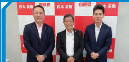
障がい者施設設備推進の要望を、鈴木英敬代議士にとどける