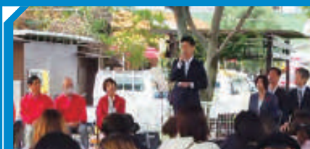
福祉の大会 ふれあい広場に参加