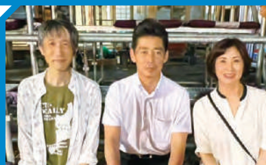
文化振興神戸石取り祭に参加