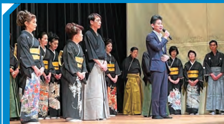
顧問をさせていただいている西尾会、伝統文化の普及啓発