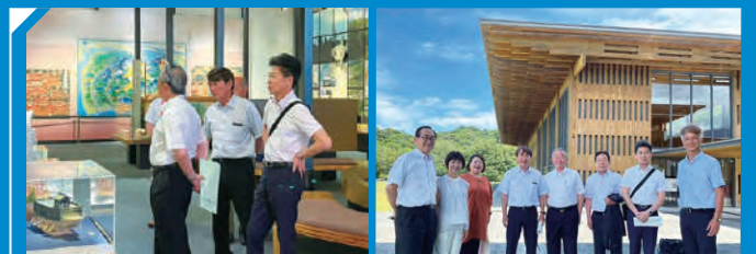
県南部地域振興のための現地調査 (観光振興、熊野古道センター等)