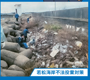
若松海岸不法投棄対策