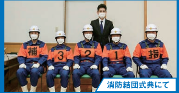
消防結団式典にて