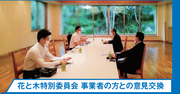
花と木特別委員会 事業者の方との意見交換