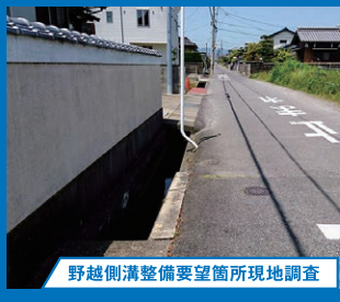
野越側溝整備要望箇所現地調査