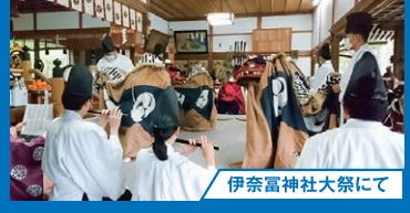
伊奈富神社大祭にて