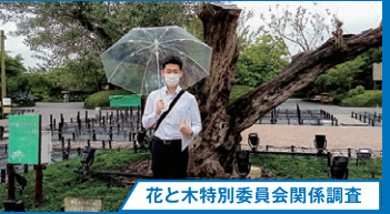
花と木特別委員会関係調査