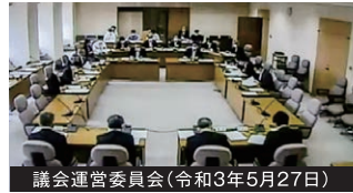
議会運営委員会(令和3年5月27日)

本年5月に議会の体制が新しく変わりました。今年度は、議会運営委員会委員長、花と木で健やかな三重をつくる条例策定調査別委員会委員長、戦略企画雇用経済常任委員会委員に就任いたしました。議会の円滑な運営と、コロナ禍における中小企業支援、雇用の維持等に関わる大変重要なポストでありますので、しっかりとその重責を果たす所存であります。さて、県内の状況はようやくコロナ第4波が収まりつつあるものの、まだまだリバウンド等予断を許さない状況にあります。第4波(3月1日から6月18日継続中)においては、第3波(11月1日から2月28日)と比べて累計感染者数は約700人増加、1日当たりの平均感染者は約8人増加の24.3人となり、また感染のスピードもはやく驚異的なものであります。これらに対応、対処するためには、1日でも早く全県民のワクチン接種が重要であり、(鈴鹿市の7月5日時点の高齢者接種率ですが、1回目45,003人・85.8%、2回目23,305人・44.4%)少しでもお役に立てるよう今後も取り組んでまいりたいと思います。今号はコロナ対策の県支援策、なかなか県民の皆様十分に周知されていないと思いますので、改めて掲載させていただきました。