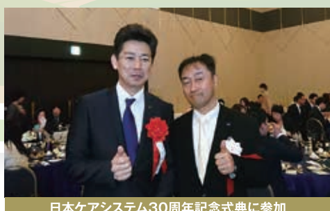
日本ケアシステム30周年記念式典に参加