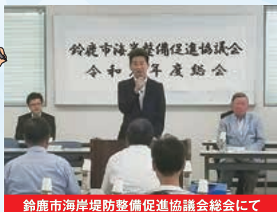
鈴鹿市海岸整備促進協議会総会にて