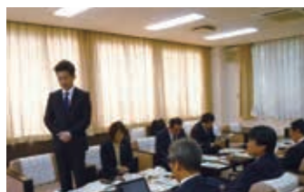
▲ 鎌倉市議会・SDGSの取組について ▲ 都議会にて住民参加型予算の調査