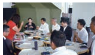
ヨコハマ海洋市民大学にて海環境問題についての調査