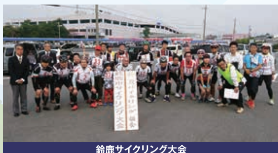
鈴鹿サイクリング大会