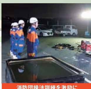
消防団操法訓練を激励に