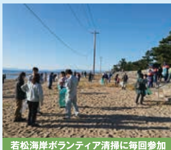
若松海岸ボランティア清掃に毎回参加