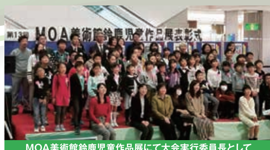
MOA美術館鈴鹿児童作品展にて大会実行委員長として