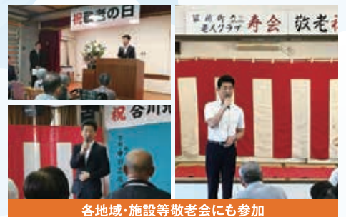
各地域・施設等敬老会にも参加