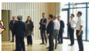
江東区議会にて木材利用促進についての調査