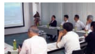
尾鷲にて水産業の現状調査