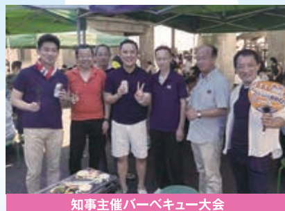
知事主催バーベキュー大会