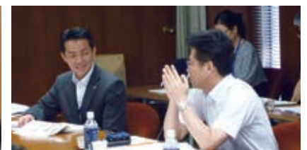
▲ 京都府議会ペーパーレス化等について調査 ▲ 広島県議会「議会のスマート化」についての調査