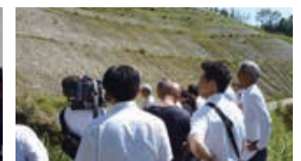
県南部にて土砂堆積現場調査