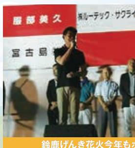
鈴鹿げんき花火今年もボランティアにて参加