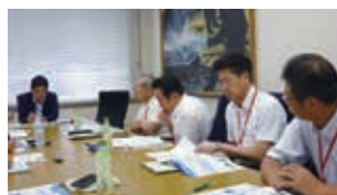
水産庁にて伊勢湾の環境対策について