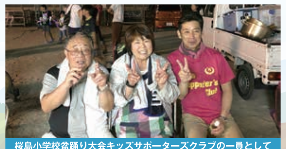
桜島小学校盆踊り大会キッズサポーターズクラブの一員として