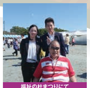
福祉の杜まつりにて