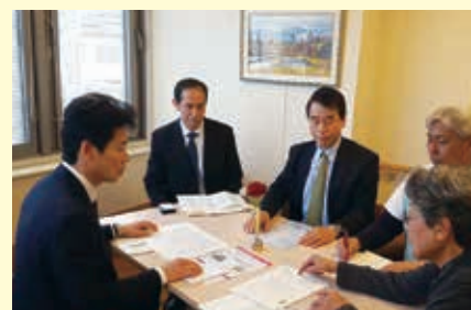
美術や書写等、文化復興についての取り組みの様子