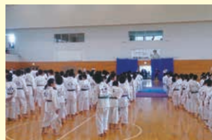
スポーツ復興、日本拳法三重県大会にも顧問として参加