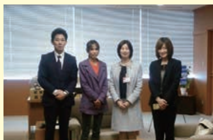
地域の産後ケア問題で助産師の方々、市長と私で意見交換