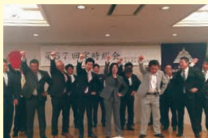
鈴鹿建設業協会総会にて、当地区県予算減少問題意見交換や今後の業界活性化のために一致団結ガンバローコール