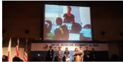
桑名長島温泉花水木で行われたジュニアサミットに所管委員会副委員長として出席