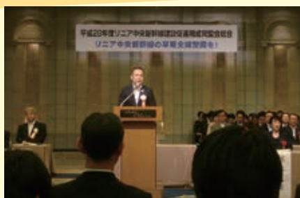
リニア中央新幹線期成同盟会総会に派遣議員として参加(東京ホテルオークラ)