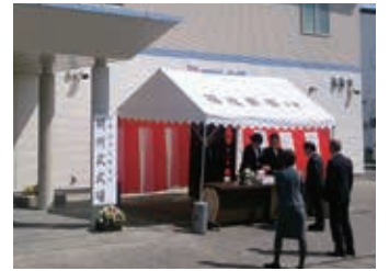
伊勢市に開設された県内4か所目の社会的事業所開所式にも参加

Q3. 社会的事業所と優先調達方針について、目標設定額の見直しや全庁的な取り組みについて、現状で良いのか。