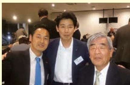
地元地域づくり、色々な団体の代表の方と意見交換