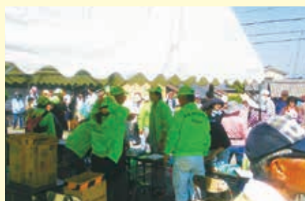
地元海岸ボランティア清掃に毎年参加