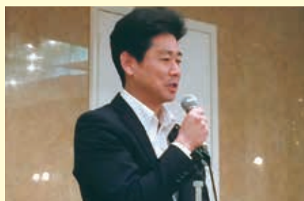
地元清掃協同組合総会にて環境美化対策など意見交換