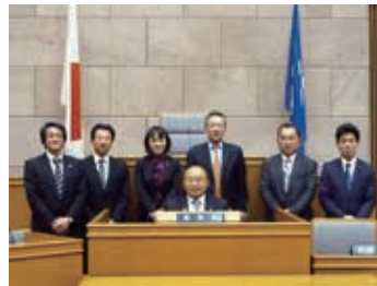
予算・決算常任委員会理事として石川県議会に視察・調査