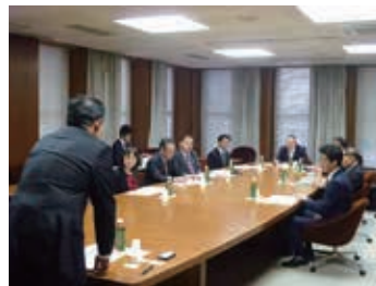
予算・決算常任委員会理事として京都府議会に視察・調査