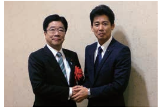
加藤一徳総活躍担当大臣とともに