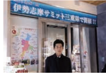
東京日本橋三重テラス視察