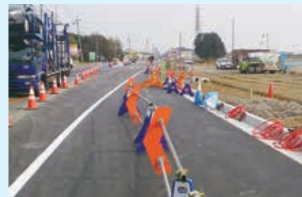
■県道整備野町付近