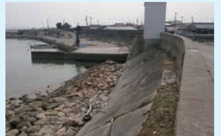
■若松地区堤防調査