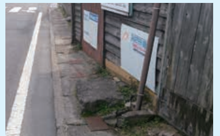
■塩浜街道側溝整備