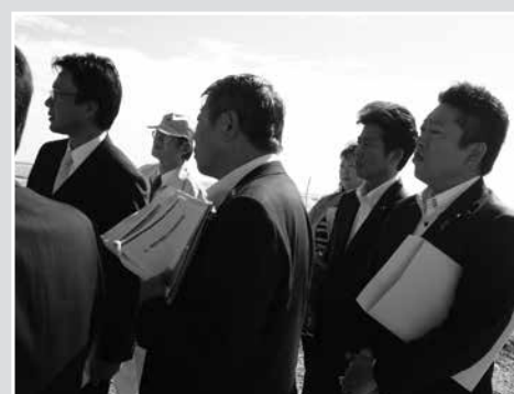
●津波で崩壊した海岸堤防の復旧現地にて