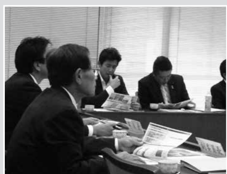
●宮城県庁舎で復興状況の説明を受ける