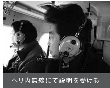
ヘリ内無線にて説明を受ける