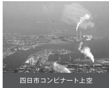
四日市コンビナート上空